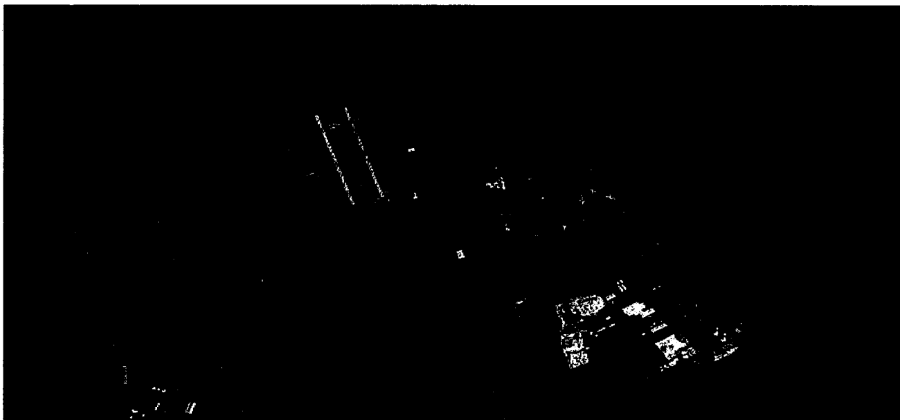
Mynd II. Sýnatökustaðir fyrir jarðveg

Skil á niðurstöðum: Niðurstöðum verður skilað til Umhverfisstofnunar þegar þær liggja fyrir. Umhverfisstofnun mun hafa aðgang að öllum mælingum er varða þessa vöktun.